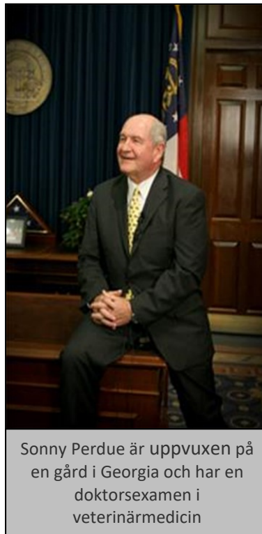
Sonny Perdue är uppvuxen på en gård i Georgia och har en doktorexamen i veterinärmedicin